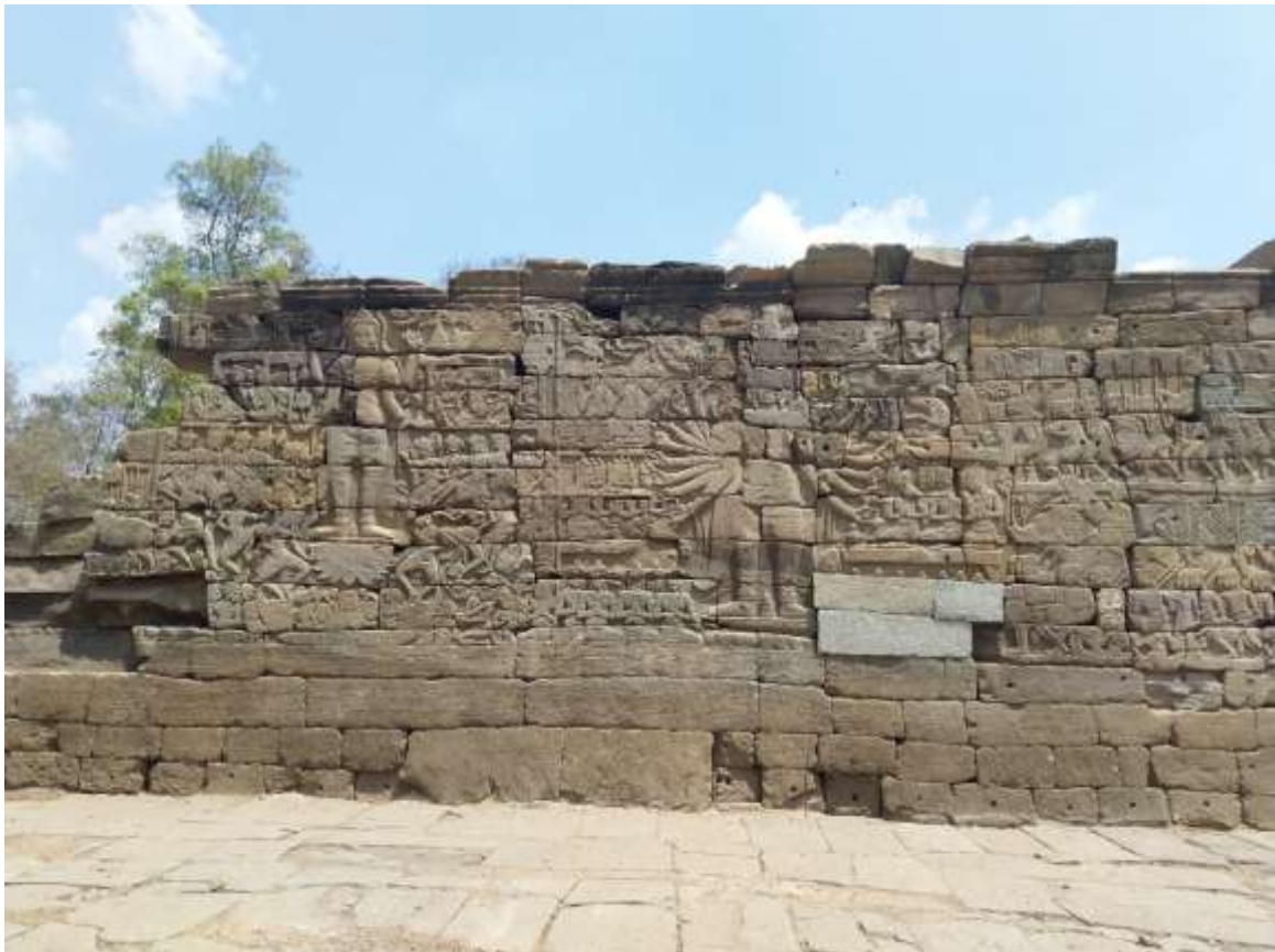
การทดลองต่อประกอบหินและการบูรณะปราสาทบันทายฉมาร์ด้วยวิธีอนัสติโลซิส พ.ศ. 2559-2560