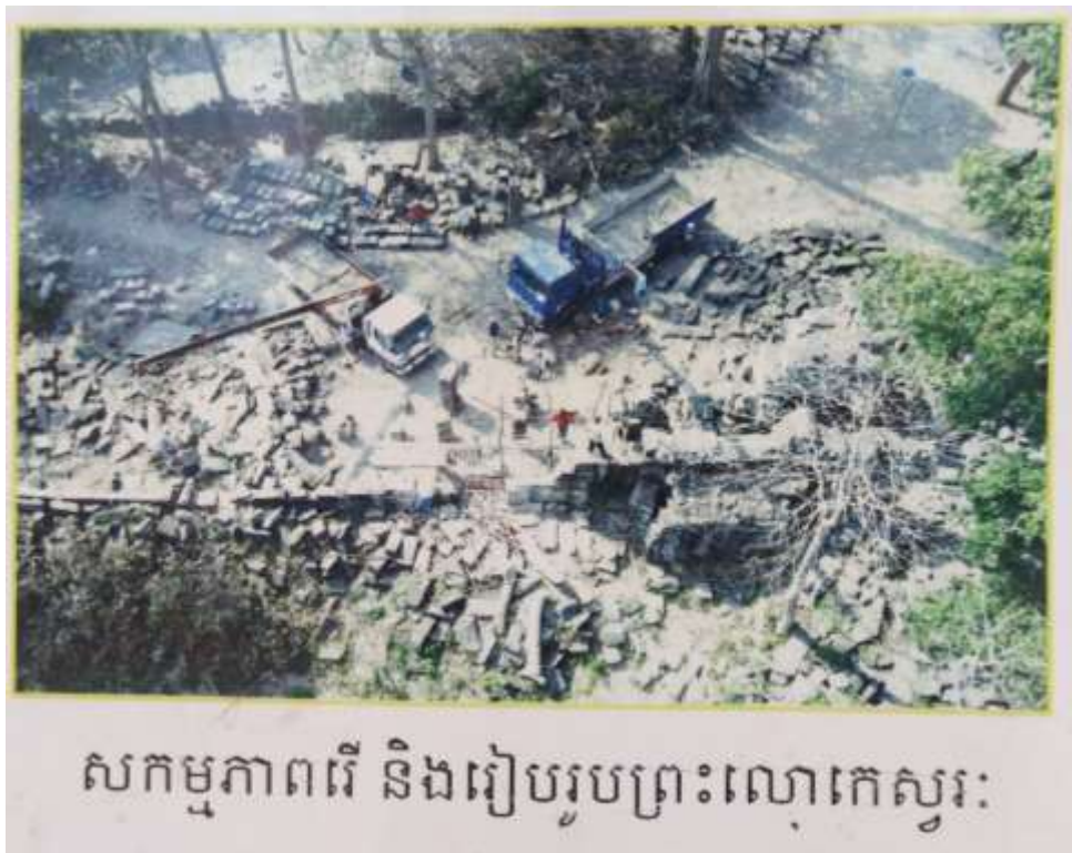
ภาพระหว่างการขุดแต่งและการบูรณะบริเวณด้านหลังปราสาทบันทายฉมาร์ พ.ศ. 2559-2560

- ความรู้ที่ได้จากโครงการขุดแต่งและบูรณะปราสาทหิน – ปราสาทบันทายฉมาร์ ด้านการวางแผน การเขียนโครงการ การประเมินลำดับความสำคัญของพื้นที่ว่าตรงบริเวณไหนต้องทำการขุดค้นและบูรณะตามลำดับก่อนหลัง การประเมินงบประมาณ และการจัดทำงบประมาณทั้งจากหน่วยงานและเอกชน เทคนิคการบันทึกข้อมูลผังหินตก-หินหล่น ผังหินที่ถูกรื้อ การขุดแต่ง เทคนิคการบูรณะด้วยวิธีอนัสติโลซิส และปัญหาการทำงานขุดค้น-ขุดแต่ง บูรณะ และอนุรักษ์ปราสาทหินจากกรณีตัวอย่างของปราสาทบันทายฉมาร์